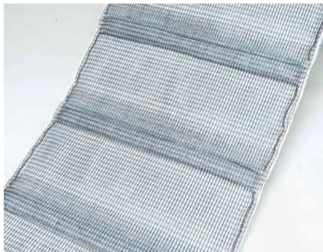
※写真はキルケットM10型です。