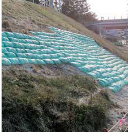
法面崩壊部分の埋戻し