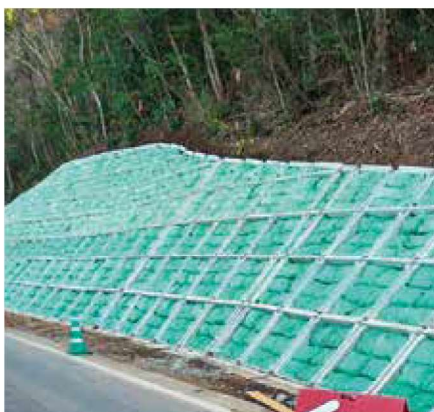
法枠グリーンバッグ工