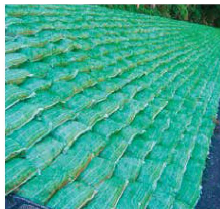
土留グリーンバッグ工