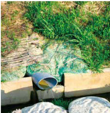
湧水箇所の崩壊防止