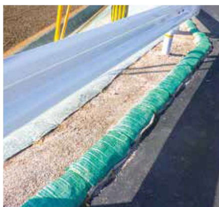
法肩まくらグリーンバッグ工