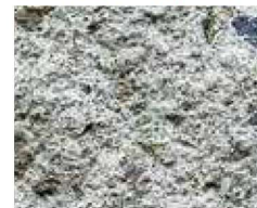
バサロン ファイバー使用